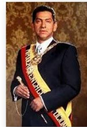
SR. CRNL. ING. LUCIO GUTIERREZ BORBÚA

PRESIDENTE DEL ECUADOR Período 2000-2003