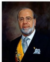
SR. DR. GUSTAVO NOBOA BEJARANO

PRESIDENTE DEL ECUADOR Período 1972-1976