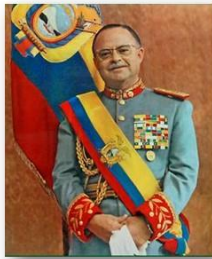
SR. GRAD. ING. GUILLERMO RODRÍGUEZ LARA

PRESIDENTE DEL ECUADOR Período 1972-1976