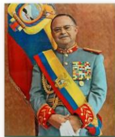
SR. GRAD. ING. GUILLERMO RODRÍGUEZ LARA

PRESIDENTE DEL ECUADOR Período 1972-1976