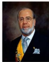
SR. DR. GUSTAVO NOBOA BEJARANO

PRESIDENTE DEL ECUADOR Período 1972-1976