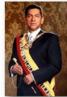
SR. CÓNUL. ING. LUCIO GUTIÉRREZ BORBUA

PRESIDENTE DEL ECUADOR Período 2000-2003