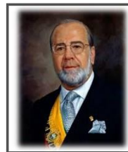
SR. DR. GUSTAVO NOBOA BEJARANO