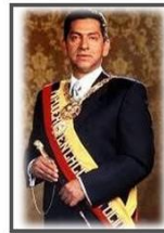
SR. CRNL. LUCIO GUTIÉRREZ B.