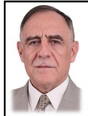
SR. GRAE. PACO MONCAYO G.