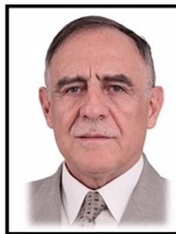
SR. GRAE. PACO MONCAYO G.