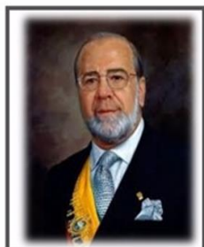
SR. DR. GUSTAVO NOBOA BEJARANO