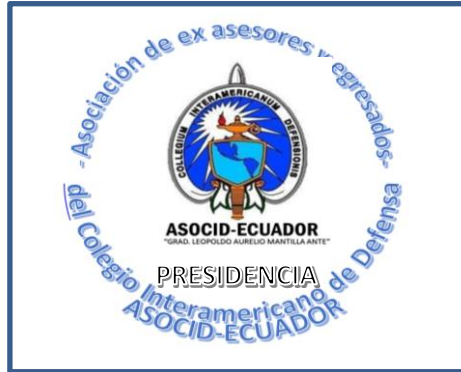
Fig. 3 Sellos

Art. 7.- Los sellos (Fig. 3) se usarán en la documentación oficial y se representará con el logotipo de la ASOCID-ECUADOR, bordeado con las palabras Asociación de exasesores y egresados del Colegio Interamericano de Defensa, en el interior se utilizará el nombre de la dependencia desde donde se emite los documentos. Podrán ser de color azul, gris, dorado o color blanco y negro.