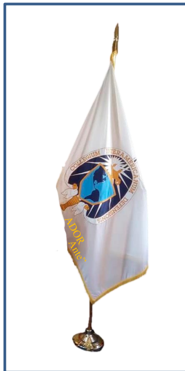
Fig. 4 Estandarte

Art. 8.- El estandarte (Fig. 4) y la bandera que representará a la ASOCID-ECUADOR, será de color blanco con filis modelo hilo de color dorado, en el centro irá el logotipo de la asociación y debajo de este sobresaliendo en letras doradas las siglas ASOCID-ECUADOR con el nombre de su patrono "Grad. Leopoldo Aurelio Mantilla Ante".