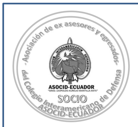
Fig. 6 La Moneda

Art. 10.- La moneda (Fig. 6) que identifica el sentido de pertenencia será redonda de color plomo con la forma exactamente igual al sello de la ASOCID-ECUADOR. En su parte inferior central constará la palabra SOCIO, se utilizará siempre y cualquiera de los socios podrá solicitar su presentación y socializar su representación.