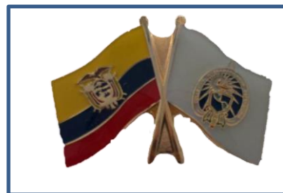
Fig. 2 Insignia