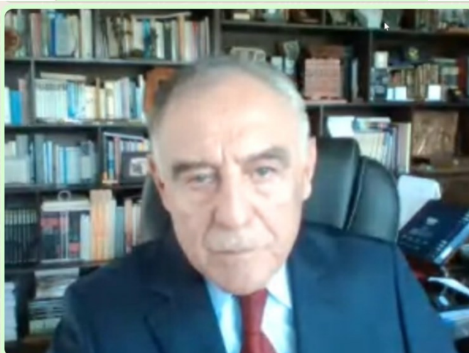
SR. GRAE. (S.P.) DR. PACO MONCAYO GALLEGOS EX-JEFE DEL COMANDO CONJUNTO DE LAS FF.AA.